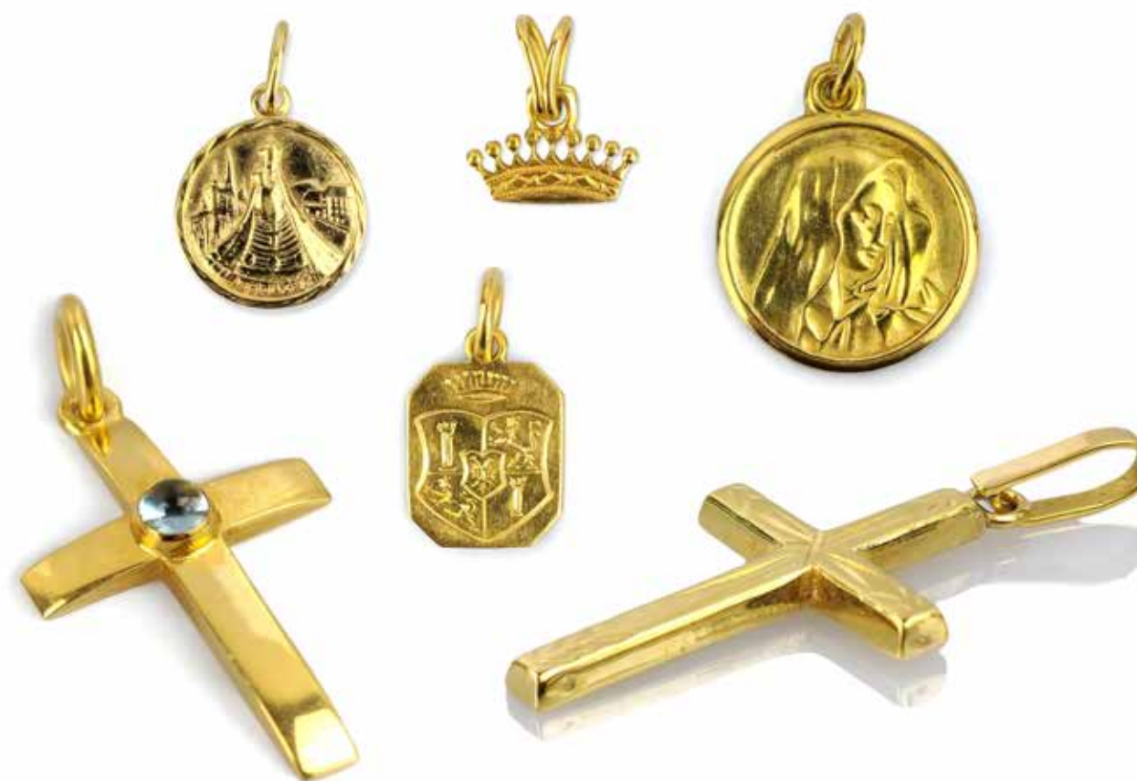
420 SUITE DE 6 PENDENTIFS

Comprenant deux pendentifs croix et deux pendentifs aux armoiries en or 18k (750) d'une part et deux pendentifs religieux en or 14k d'autre part. Poids brut : 5,13 gr (18k) - 3,29 gr (14k)