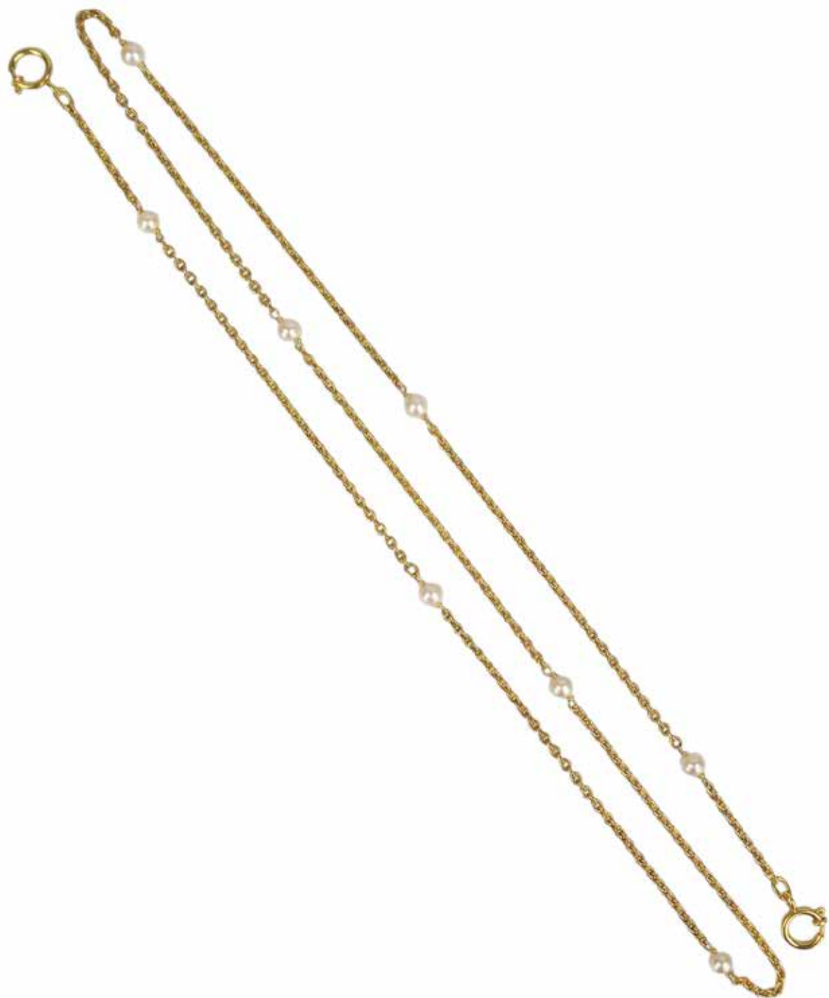
490 COLLIER CHAÎNE

En or jaune 18k (750), à mailles jaseron alternées de perles de culture, le fermoir en or 14k rapporté. Poids brut : 15,20 gr - Longueur : 79 cm