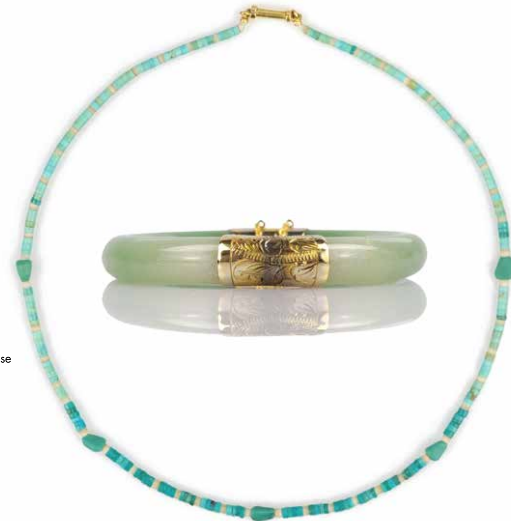
477 COLLIER ET BRACELET

Le collier formé de petites rondelles et de galets en turquoise alternées de pierres dures, le fermoir en or 18k (750), le bracelet jonc en jade et métal doré sculpté (accident). Longueur : 41 cm