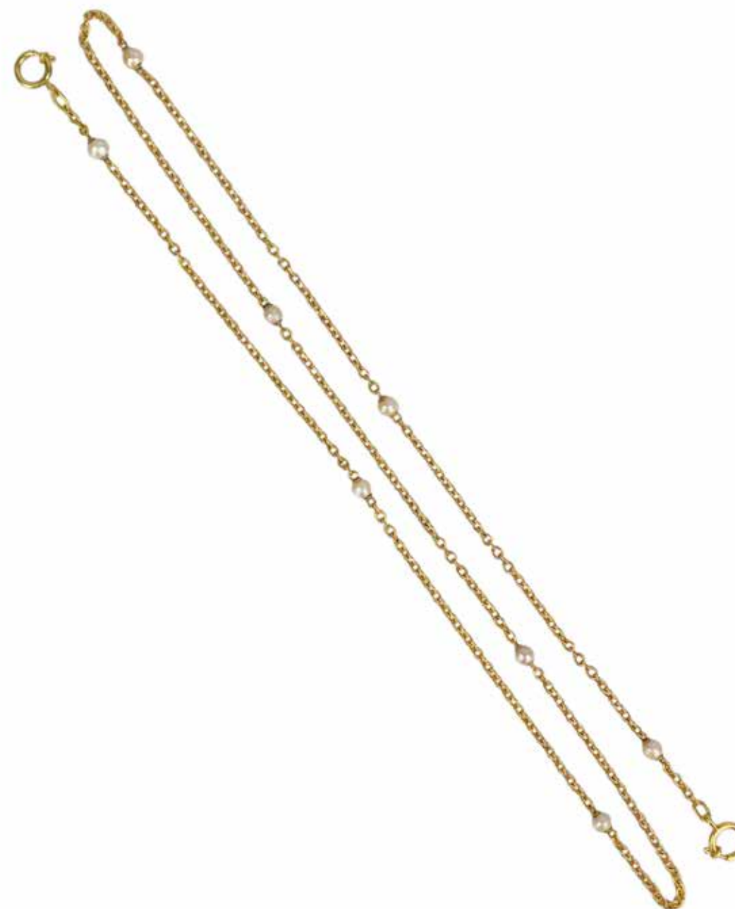
491 COLLIER CHAÎNE

En or jaune 18k (750), à mailles jaseron alternées de perles de culture, le fermoir en or 14k rapporté. Poids brut : 22,13 gr - Longueur : 79 cm