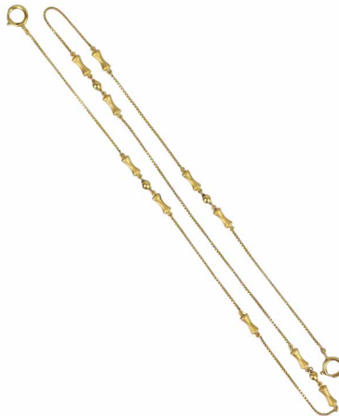
495 COLLIER CHAÎNE

En or jaune 9k (375), à mailles vénitienne alternées de bâtonnets et de perles ovoïdes, le fermoir à double anneau ressort. Poids brut : 17,22 gr - Longueur : 78 cm