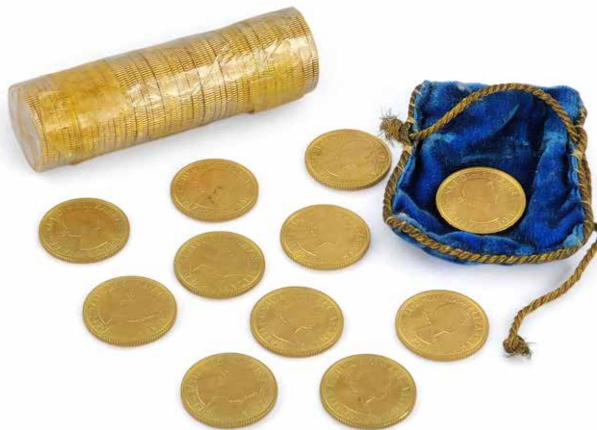
408 61 PIECES OR SOVERAIN ELIZABETH II

En or 917/000, gravées par May Gillick dont 1 frappe de 1958, 10 de 1959, et 50 sous plastique, la dernière laissant apparaître 1963 Diamètre : 22 mm Poids à l'unité : 7,99 g - Poids total : 487 gr