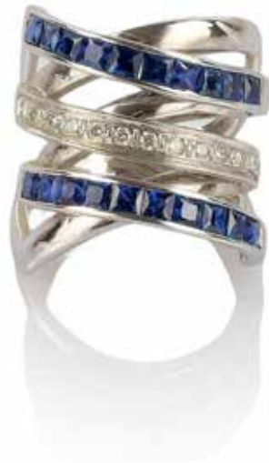
480 BAGUE DIAMANT ET SAPHIR

En or gris 18k (750), formée de six lignes entrecroisées dont trois serties de saphirs calibrés et d'un pavage de brillants. Poids brut : 8,55 gr - TDD : 51,5