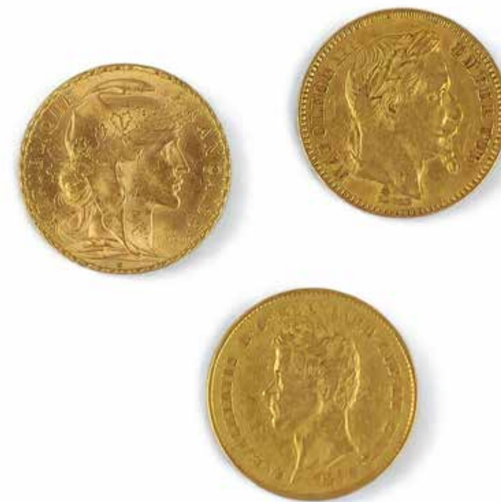
406 TRIO DE PIECES EN OR

Composé d'une pièce de 20 frs Napoleon III, Empire Français 1861; une à l'effigie de Charles Albert Royaume de Sardaigne de 1834 et une pièce de 20 frs de 1906 Dieu Protège la France. Poids total des 3 pièces : 19,26 gr