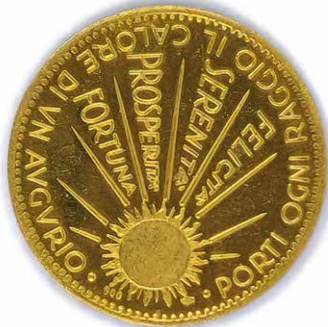
403 « AS MANY WISHES AS STARS »