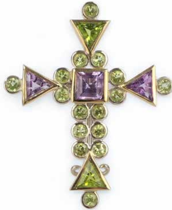
446 CECILE von CROÏ

Croix sur pied En or gris 18k (750), orné de péridots et d'améthystes taille rond, triangle et carré, avec pied déployant à l'arrière. Signée Croÿ. Poids brut : 10,18 gr - Hauteur : 4,5 cm