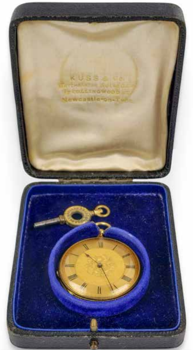
487 HUTTON, EDIMBOURG