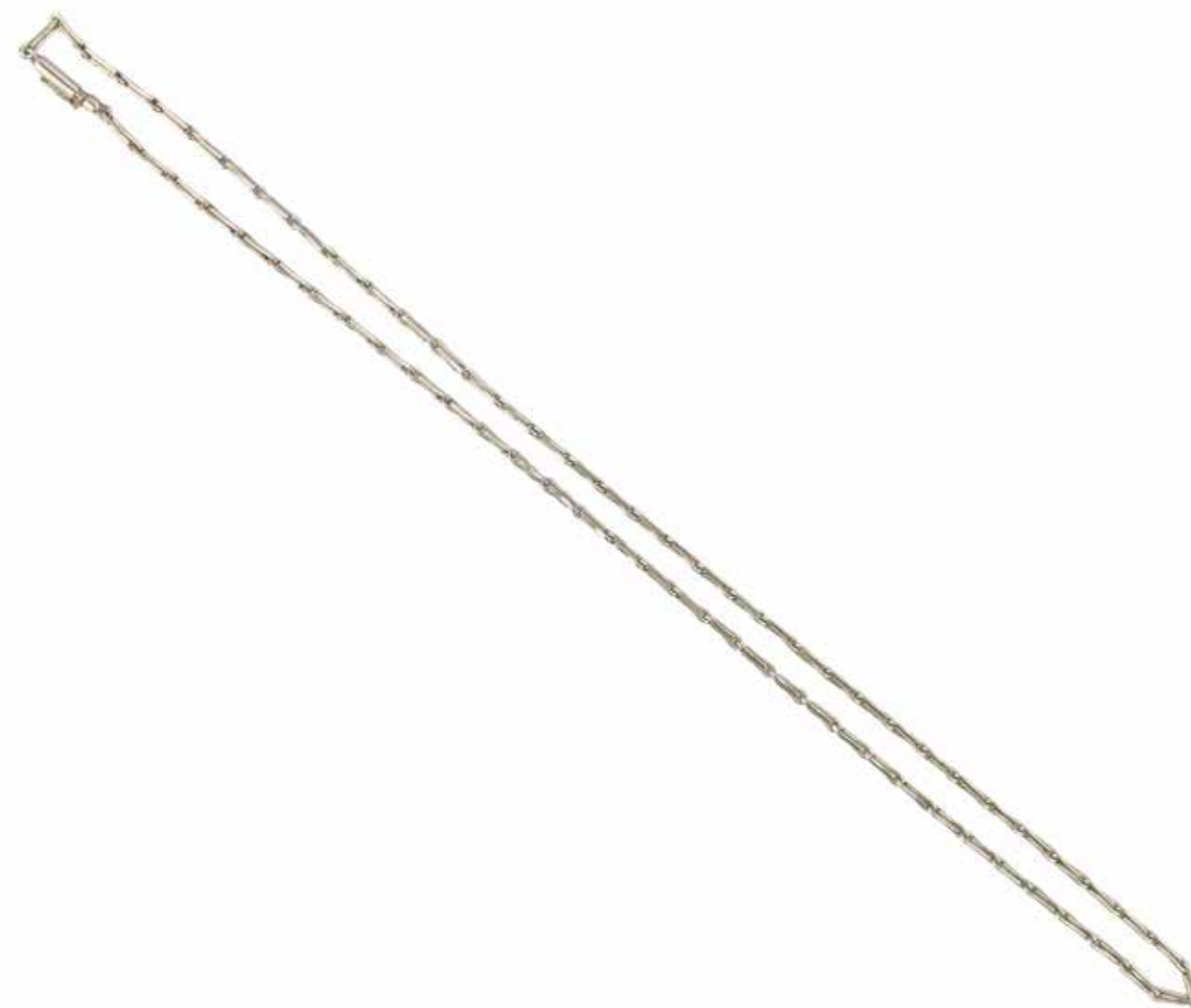
509 COLLIER CHAÎNE

En platine, formé de maillons allongés. Poids brut : 20,85 gr - Longueur : 47 cm