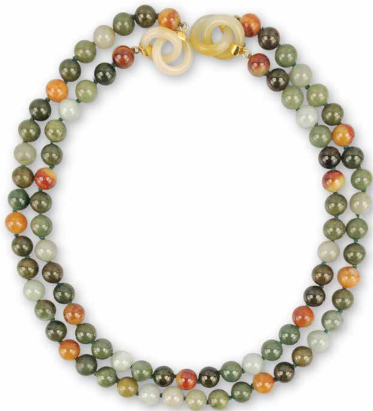
469 SAUTOIR JADE JADEITE