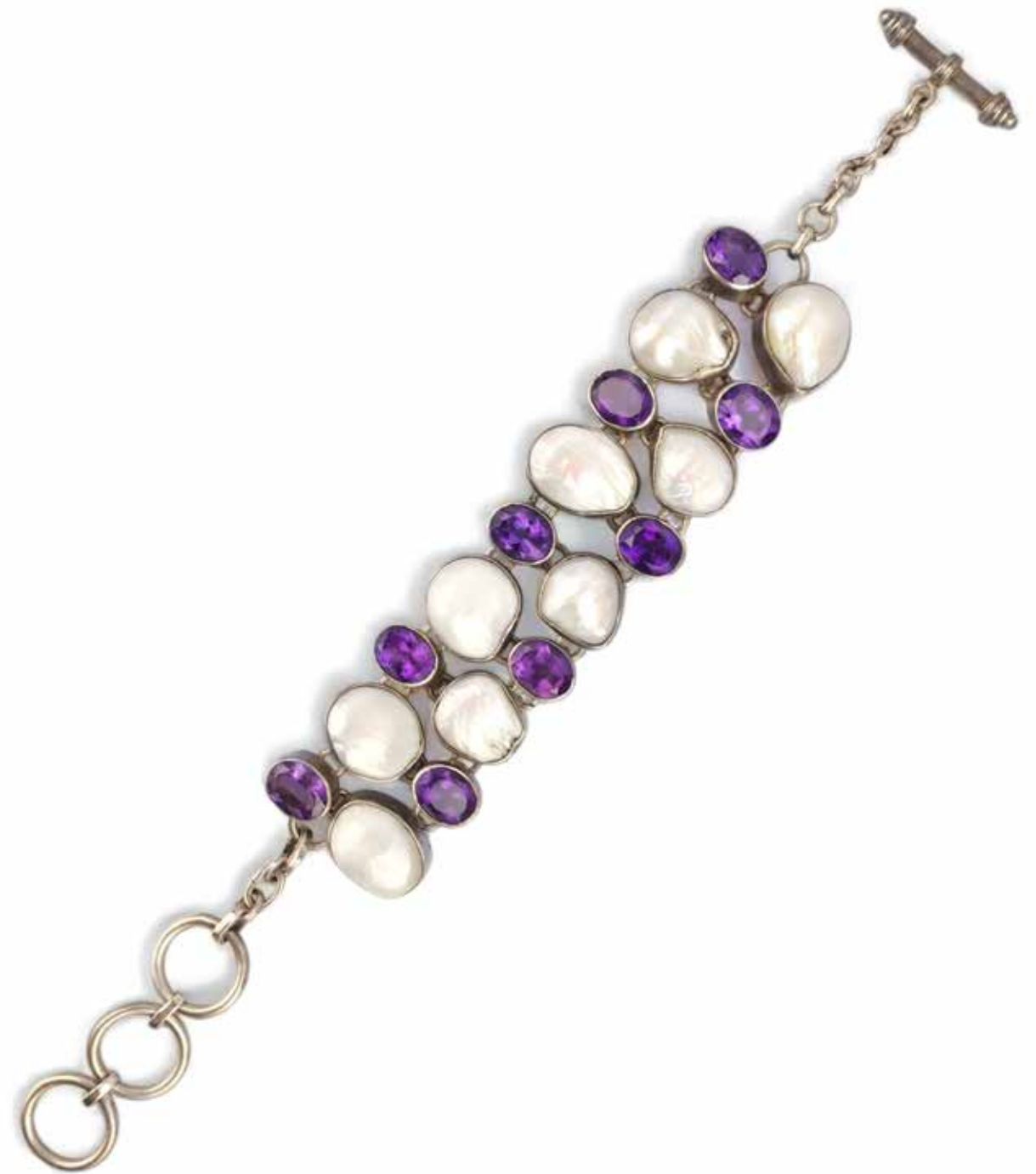
447 BRACELET ARTICULE ca.1960

En argent 925/000, orné de perles et d'améthystes en serti clos. Poids brut : 66 gr - Longueur : 22 cm