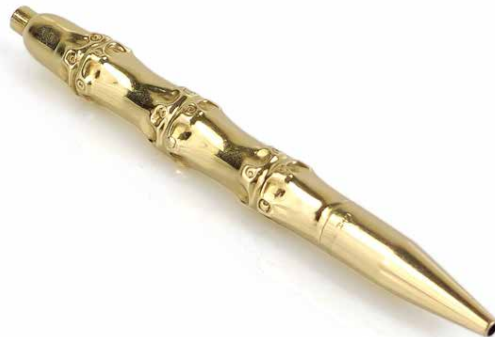
513 TIFFANY & Co