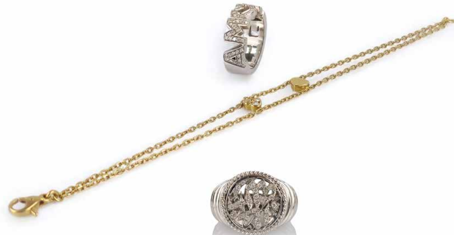
483 DUO DE BAGUES ET BRACELET

Ensemble comprenant une bague en or gris 18k (750) ajouré avec l'inscription «Machallah» (traduite de l'arabe) pavée de brillant, l'anneau à décor fileté. Poids brut : 11,61 gr - TDD : 52, une bague avec anneau en or gris 18k (750) stylisé des lettres «Amore» pavées de brillants et un bracelet en or jaune formé de deux chaînes retenant deux cœurs dont un pavé de brillant, poids brut : 14,37 gr - Longueur : 17 cm - TDD : 50