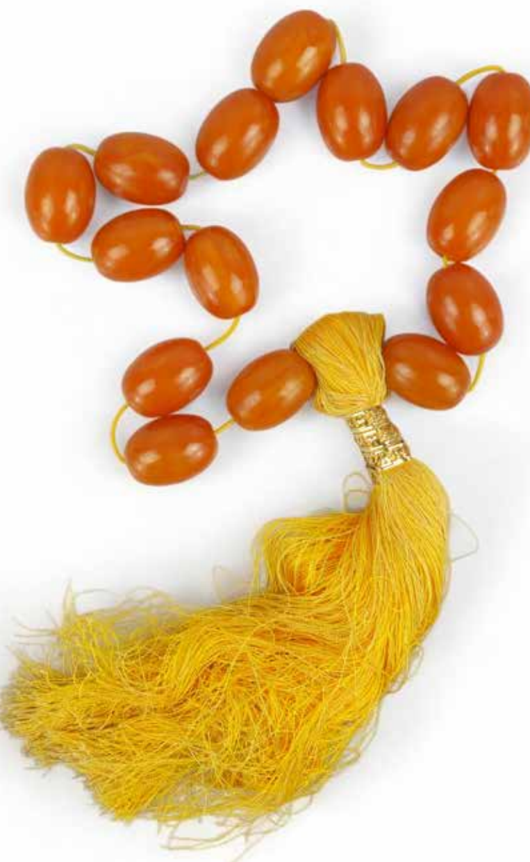
471 CHAPELET AMBRE

Composé d'importantes perles ovoïdes d'ambre et finissant par un pompon. Poids brut : 417 gr