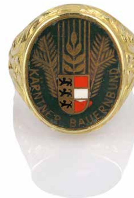
424 BAGUE CHEVALIERE ARMORIEE

En or jaune 14k (585), aux armoiries de la Fédération des Paysans de Carinthie. Poids brut : 12,75 gr - TDD : 65