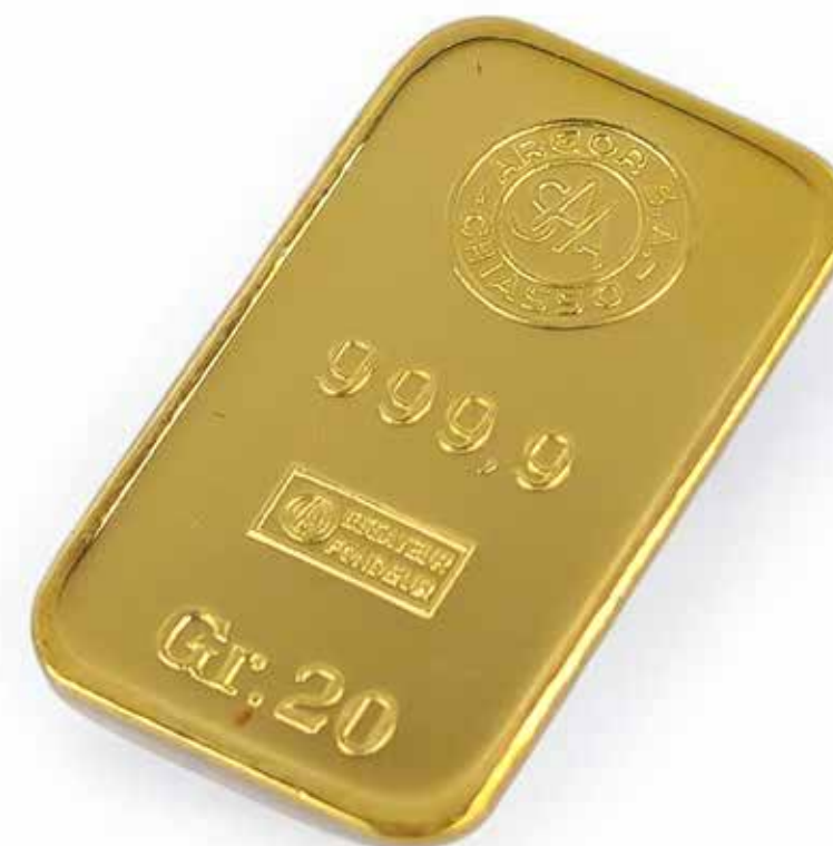
404 ARGOR S.A CHIASSO