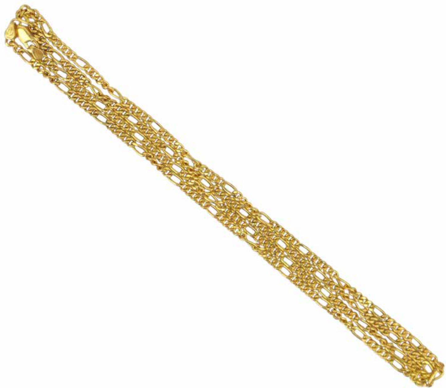
512 COLLIER CHAÎNE

En or jaune 18k (750), à mailles figaro. Poids brut : 37,11 gr - Longueur : 84 cm