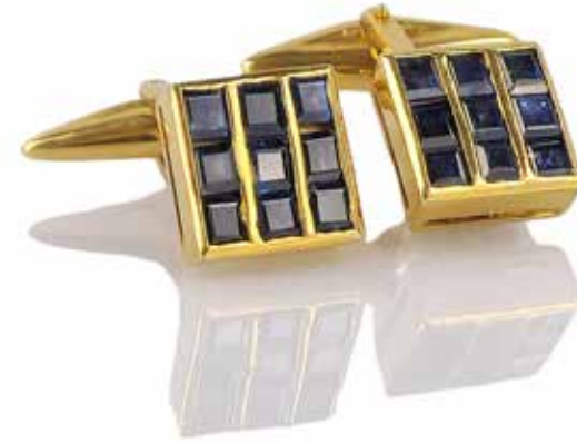
482 ZENDRINI, ROMA