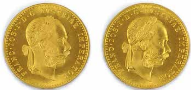
405 2 DUCATS D'OR, 1915