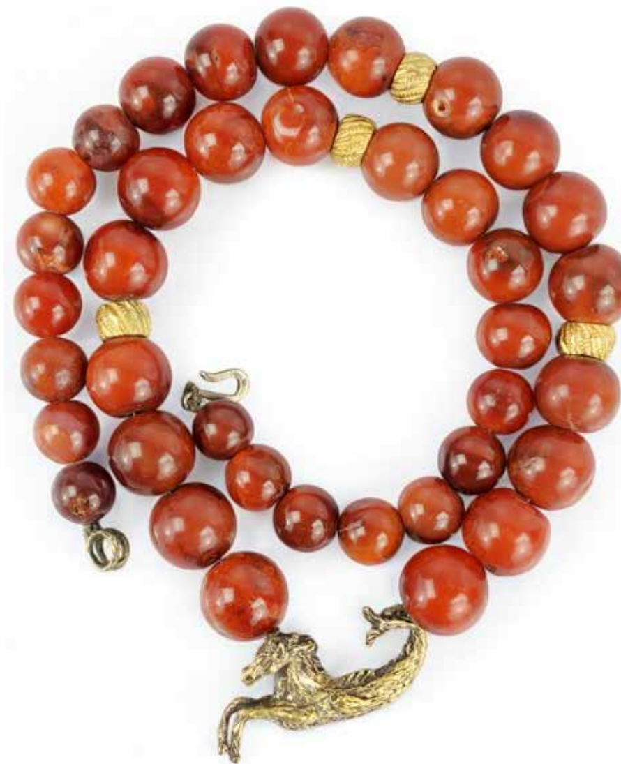
470 COLLIER CORNALINE

Formé d'une ligne de perles de cornalines en chute entrecoupée de quatre anneaux striés en métal doré et retenant un cheval en vermeil martelé. Diamètre : 14,38 - 20,07 mm - Longueur : 67 cm