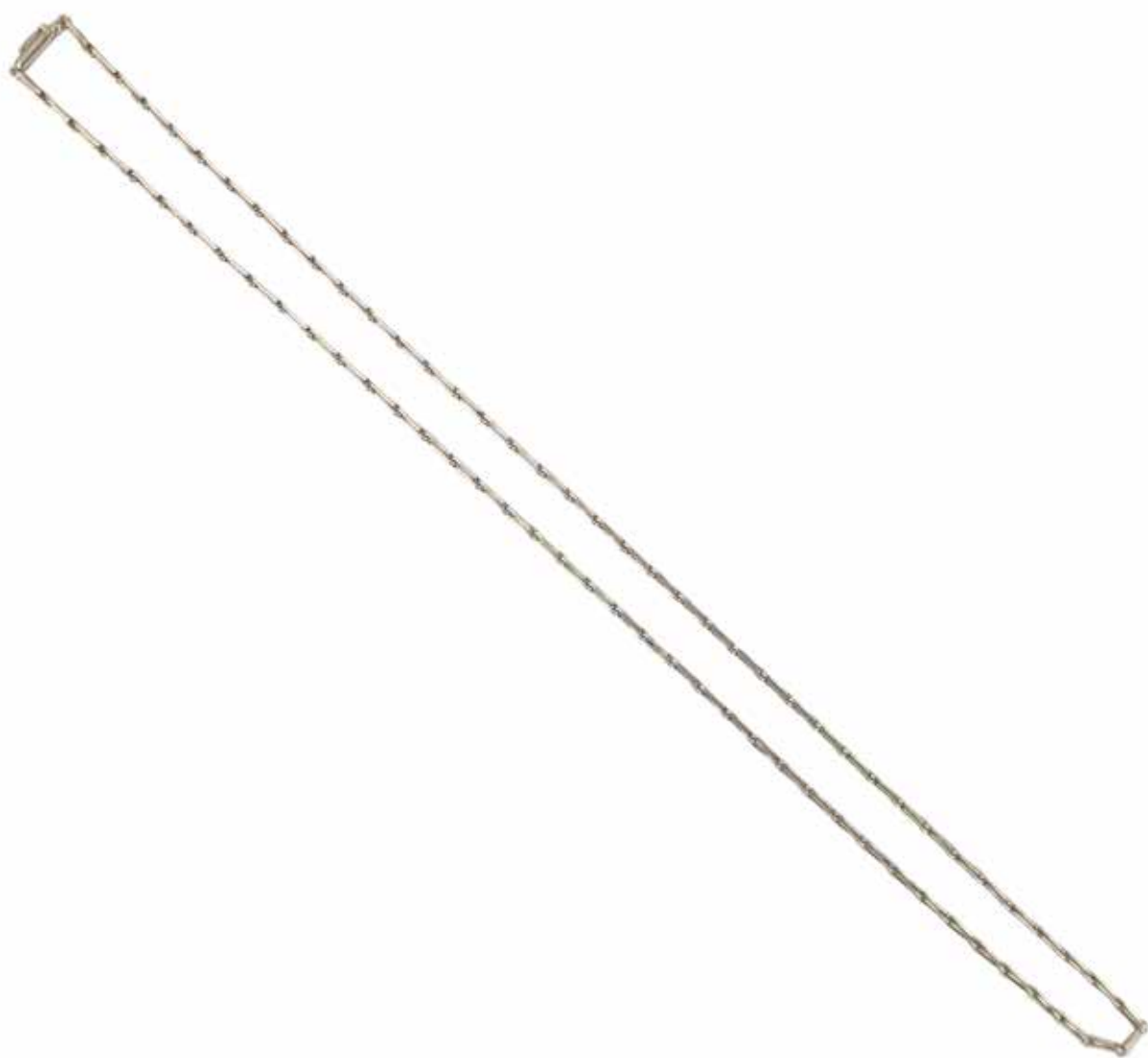
508 COLLIER CHAÎNE

En platine 850/1000, formé de maillons allongés. Poids brut : 23,64 gr - Longueur : 53 cm