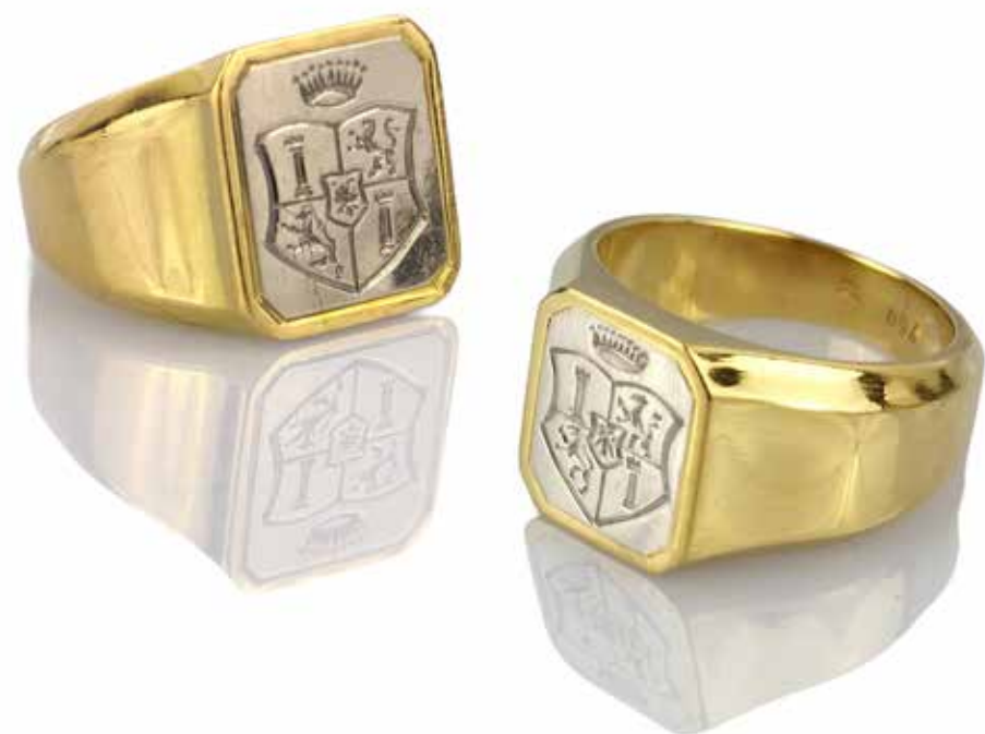
419 CECILE von CROÏ