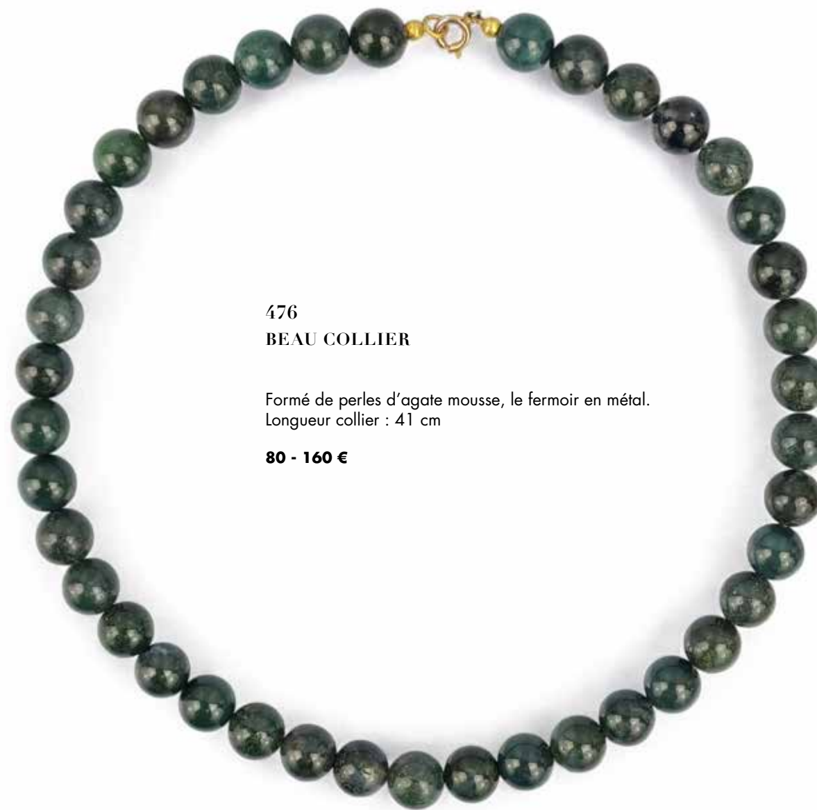
476 BEAU COLLIER

Formé de perles d'agate mousse, le fermoir en métal. Longueur collier : 41 cm