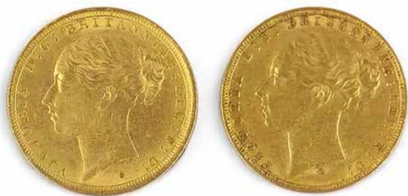
407 SOVERAIN OR, ANGLETERRE 1879

Reine Victoria En or 916,7/000 Diamètre : 22 mm Poids total des 2 pièces : 15,91 gr