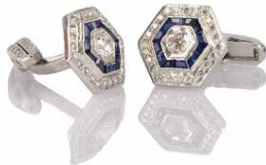
481 PAIRE DE BOUTONS DE MANCHETTE

En or gris 18k (750), centrés d'un diamant taille rond d'environ 0,83 carat dans un entourage de saphirs calibrés et de diamants taille ancienne, les attaches pivotantes brillantées.