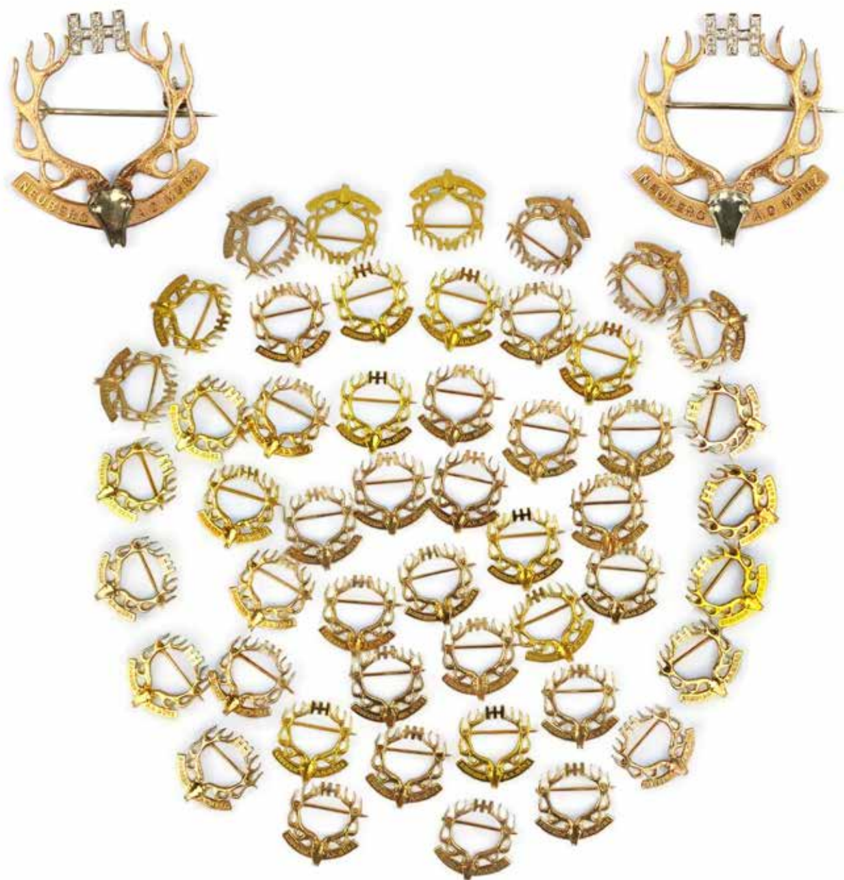
423 LOT DE 51 EPINGLES A CHAPEAU

Aux deux ors 14K (585), stylisées de têtes de cerf monogrammés HH dont deux pavées de brillants. Poids brut : 259 gr - Dimensions : 3 x 3 cm